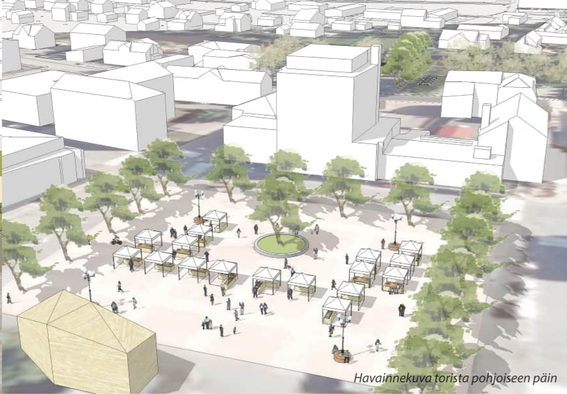
Havainnekuva torista pohjoiseen päin