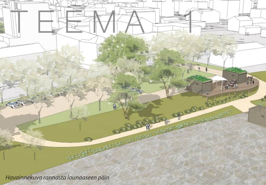
Havainnekuva rannasta lounaaseen päin