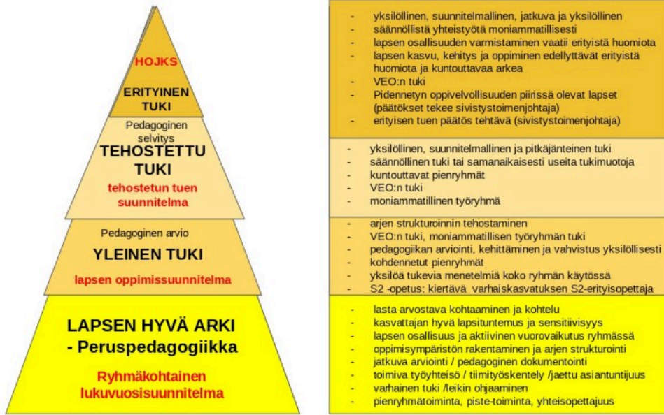
Kolmiportainen tuki esiopetuksessa