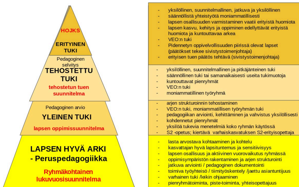
kolmiportainen tuki esiopetuksessa

Tehostettuun tukeen siirryttäessä asiasta keskustellaan aina ensin huoltajien kanssa. Tehostetun tuen suunnitelma laaditaan moniammatillisessa työryhmässä. Työryhmään kuuluu lapsen huoltajat ja lapsen ikä huomioiden myös lasta kuullaan ja hänen osallisuutensa prosessissa on tärkeää. Kolmiportaisen tuen mallissa voidaan kehityssuunnasta riippuen liikkua molempiin suuntiin huomioiden varhaiskasvatuksessa jo tehdyt päätökset. Tukitoimia voidaan tarvittaessa lisätä tai keventää. Ainoastaan erityisen tuen päätös ja pidennetyn oppivelvollisuuden päätös etenevät virkamiespäätöksillä ja tällöin niihin on oltava painavat perusteet. Erityisen tuen päätös on usein pysyvämpi ratkaisu ja sen tulee olla lapsen edun mukainen.